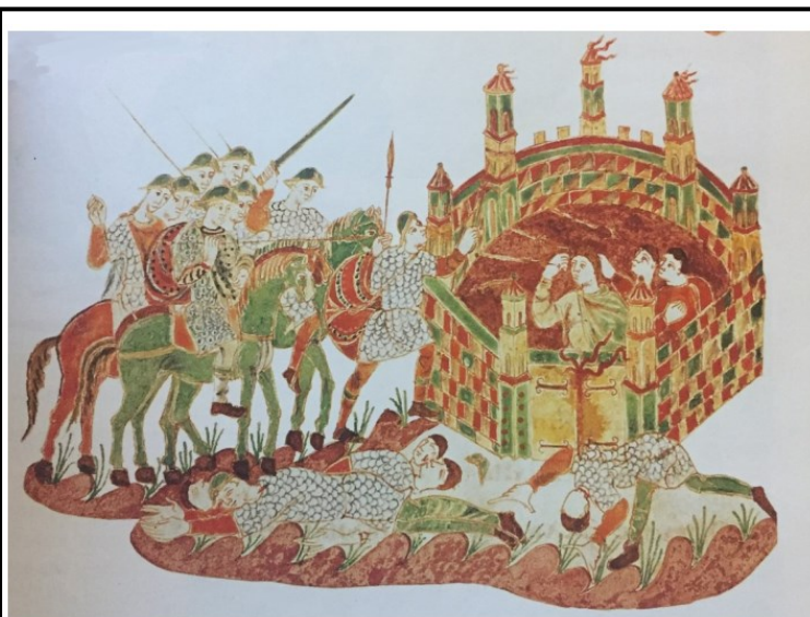
L'attaque d'un château fort, miniature du IX e siècle