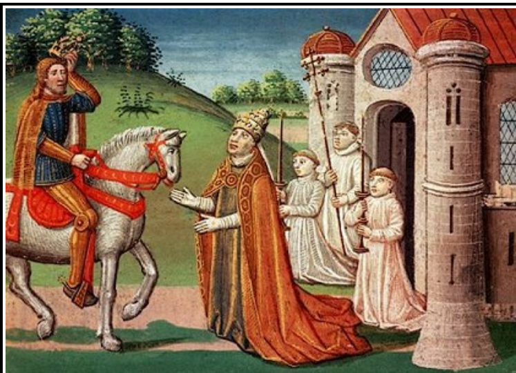
Pèlerinage de Charlemagne à Rome