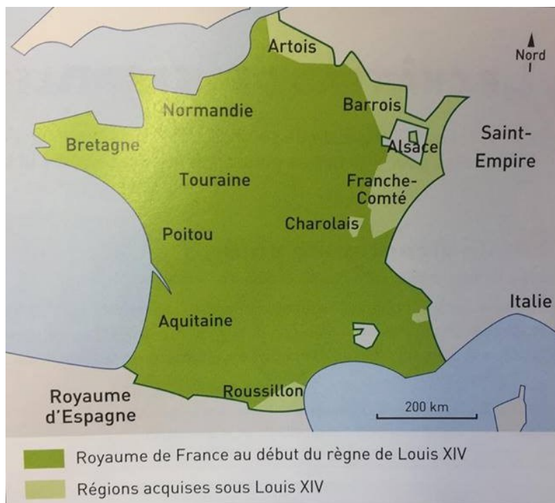
Carte de la France sous Louis XIV

Louis XIV chargea un autre ministre, Colbert, de moderniser l'économie du pays. Celui-ci créa des manufactures qui fabriquaient des meubles, des miroirs, des tapisseries et des objets d'art vendus en France et dans toute l'Europe. Il développa le commerce avec les pays voisins. Au XVIII e siècle, la France était l'un des pays les plus riches d'Europe.